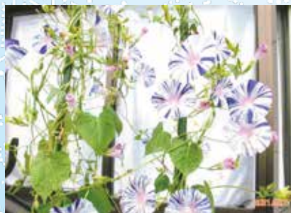
しゅうれい 秋冷や むすんでひらいて また来年