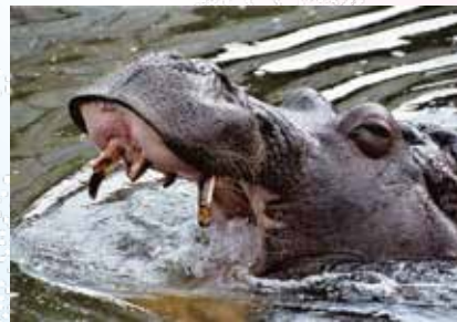
はるかな 春隣り 体重計に こそと乗り