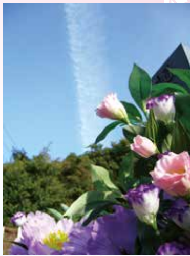
花の香と 競い立ちたり 雲の丈