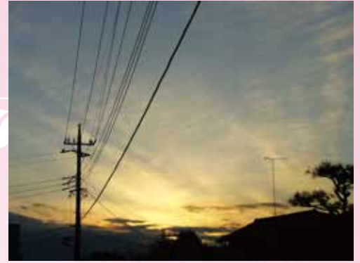
またの日も ありと思へと 翺雲