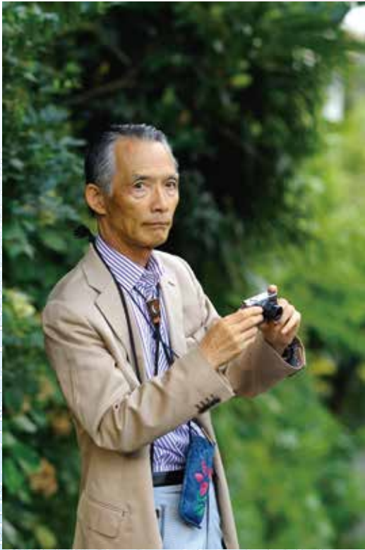
森村誠一氏