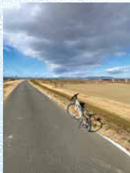
目指す先 同じと示す 雲の腹

熊谷市立熊谷図書館 電話：048-525-4551 受付時間 午前9時から午後5時まで