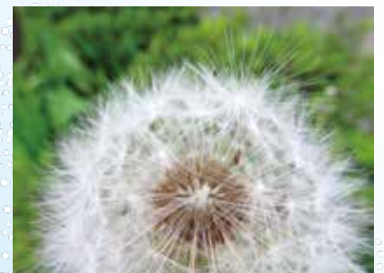
春風に 背中押される 意気地なし