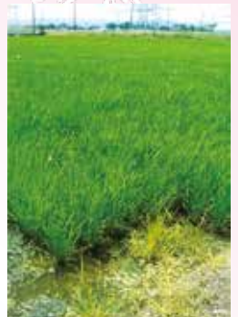
夏の田やおにぎりまでの長い道