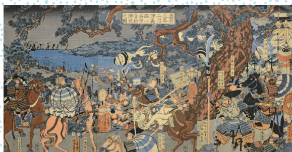
壽永三年二月 源義經 一ノ谷宗音松陣取之圖